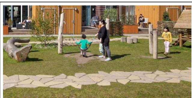
Voorbeeld kleine achtertuinen met gezamenlijke binnentuin

Na het onderwerp parkeren gaan we over op groen. Een bewoner merkt op dat ze de parkeerplaatsen het liefst zo groen mogelijk ziet, dus bijvoorbeeld met graskeien. Mitros staat hier positief tegenover, maar er kan nog geen harde toezegging worden gedaan. Meerdere bewoners zien het liefst (hoge) bomen toegevoegd worden in de binnenterreinen, om zoveel mogelijk privacy te houden. Al is er ook een bewoner die de bomen het liefst zo laag mogelijk zit om zo min mogelijk last te hebben van de schaduw. De algemene gedachte is om de woningen op de begane grond een kleine achtertuin te geven en daarnaast een gezamenlijke binnentuin te realiseren. Mitros zal het beheer van deze gezamenlijke binnentuin voor haar rekening nemen. Deze gezamenlijke tuin zal waarschijnlijk alleen voor de bewoners van dat deelgebied toegankelijk zijn.